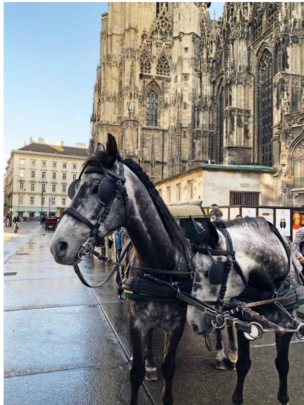
上图起顺时针:维也纳圣史蒂芬大教堂;远眺奥地利萨尔茨堡;瓦豪河谷梅尔克修道院。