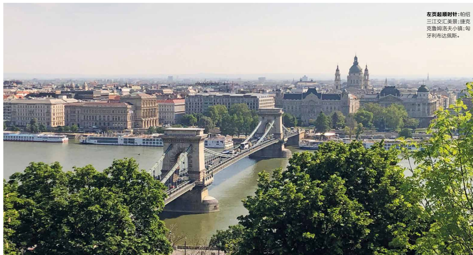
左页起顺时针:帕绍三江交汇美景;捷克克鲁姆洛夫小镇;匈牙利布达佩斯。