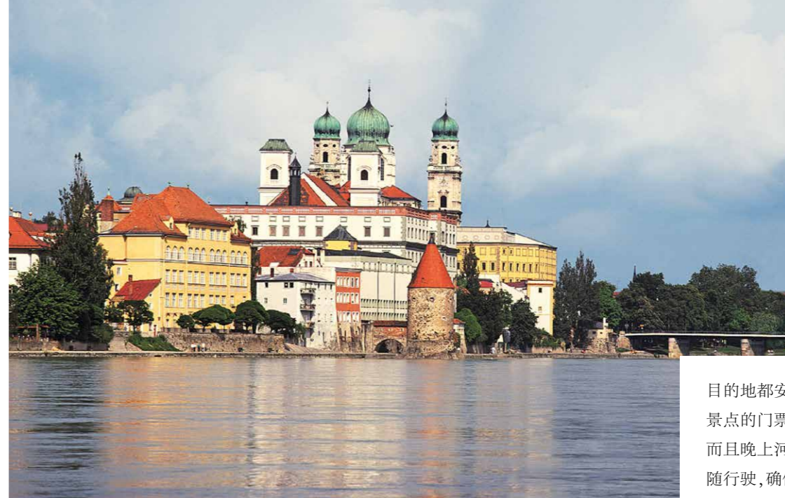
左页起顺时针：停靠在布达佩斯的维京姐妹游轮；德国帕绍小镇；维京Freya客房景致。

目的地都安排了导游带领宾客上岸参观。景点的门票、导游、大巴都不用另外付费。而且晚上游轮航行时，大巴车也在岸上跟随行驶，确保第二天早上的用车没有后顾之忧。全程三餐已经包括在船票里了，所以船上的用餐不需要另外付费。特别是除了各种饮料畅饮外，船上酒吧里供应的红酒、白酒、啤酒，甚至鸡尾酒也都是免费畅饮的。贴心的面吧从早到晚为大家提供花样繁多的面食。